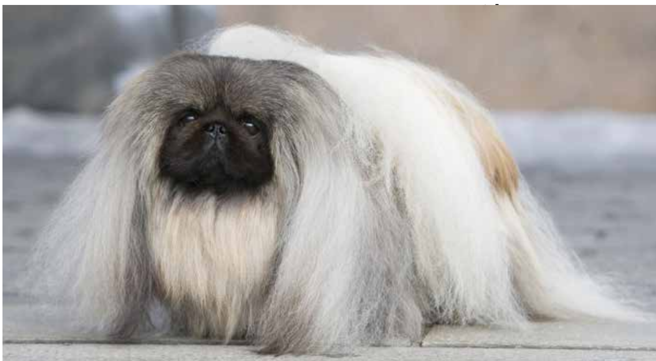
LC-E. Cão: Palacsgården Malachy, melhor da exposição Westminster 2012

Saiba como é a vida com esse chinês peludo em diferentes famílias brasileiras